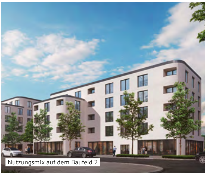
Nutzungsmix auf dem Baufeld 2