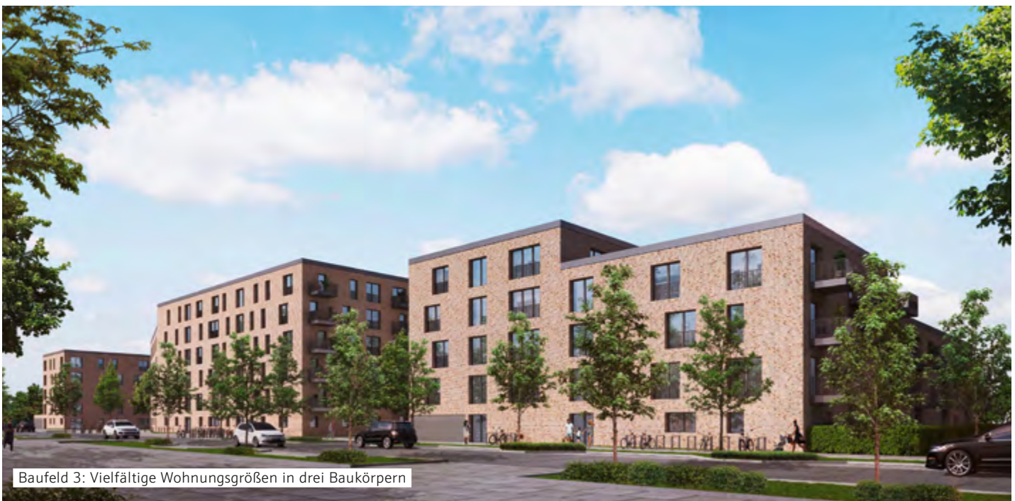
Baufeld 3: Vielfältige Wohnungsgrößen in drei Baukörpern