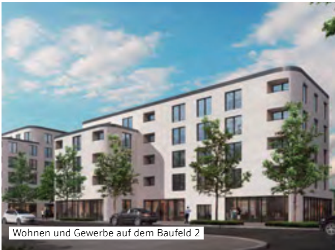
Wohnen und Gewerbe auf dem Baufeld 2